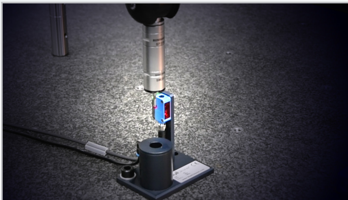
5. Wenn der Taster wieder über der Reinigungseinheit steht, ist der Reinigungszyklus abgeschlossen und der Taster ist wieder sauber