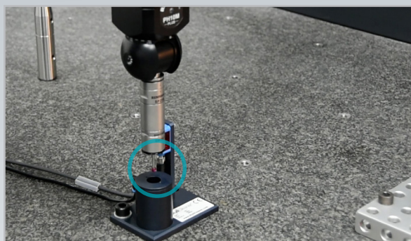
2. Sobald der Taster über der Reinigungseinheit steht, kann der Taster gereinigt werden