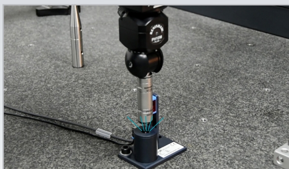
4. Durch den Einsatz von Druckluft und Reinigungsmittel wird der Sensor gereinigt