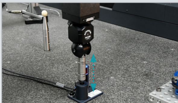
3. Der Taster bewegt sich 20 Sekunden lang nach oben und unten durch die Reinigungseinheit